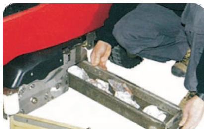
Edelstahl-Kehr-Walzenschubbaggagrat mit Grobschmutzsammelbehälter