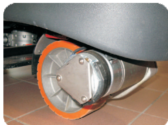
Direktantrieb über das Vorderrad