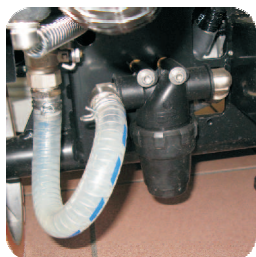
Frischwasserfilter leicht zugänglich